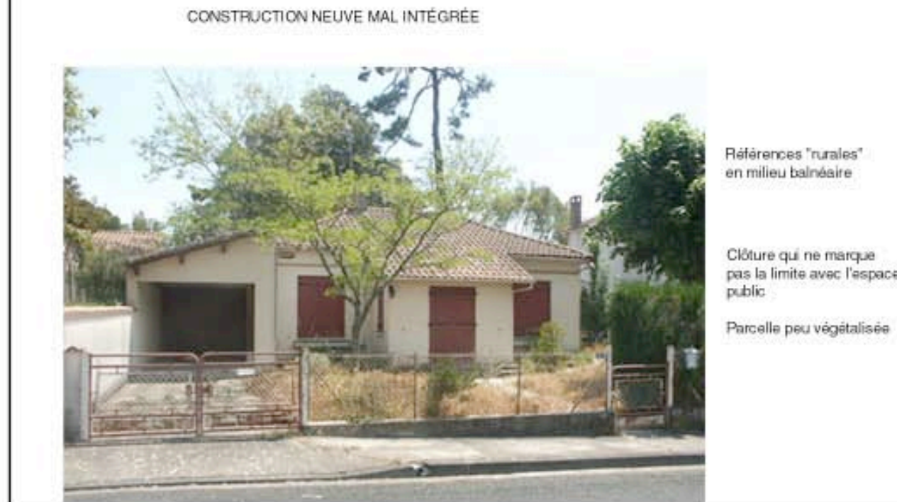
CONSTRUCTION NEUVE MAL INTÉGRÉE

Références "rurales" en milieu balnéaire